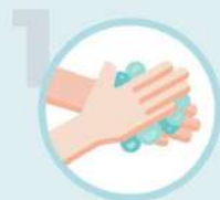
1 Frotte, mousse, rince