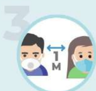
3 Garde tes distances !