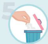
5 Mon mouchoir ? À la poubelle !