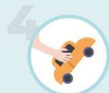
4 Chacun ses jouets !