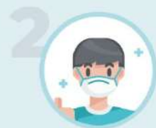
2 Je porte mon masque