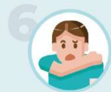
6 je tousse ou étérne dans mon coude

Cartons verts et bons points à tous ceux qui respectent les règles